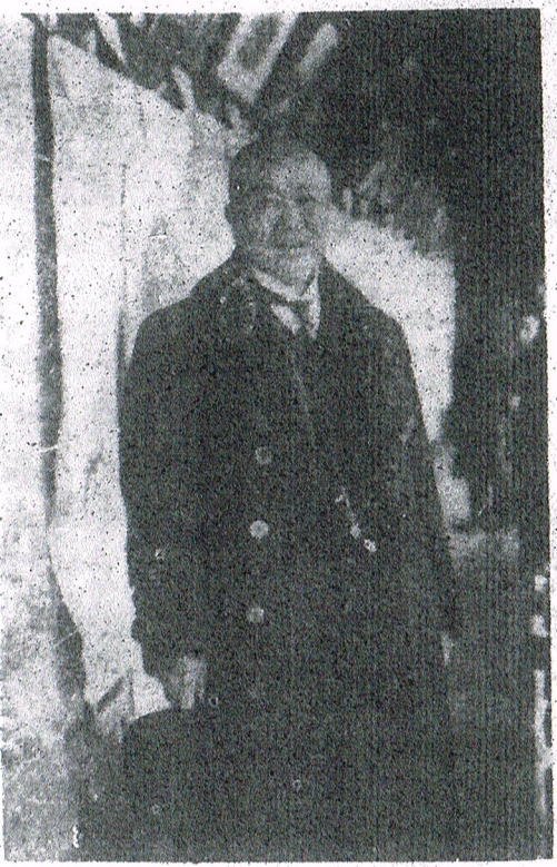
(氏行兼付肝るたれさ觀來)

小野さんはむきになつて辯解なさる。 「だつて君、あれは何だよ、僕があれを描いてるとねえ、社の某君なんか傍で見えてゐて、誰にでも描けるやうに思つてね、オイ俺にも一本描かせろなんて云ふんだもの、よしたまへく、見てゐると何の譯もないやうだがこれで中々こつがあるんだからよしたまへつて、幾ら僕がとめても、無理矢理一本引ばるんだもの、堪らなう」 「成る程それは堪らないね」 「だから見たまへ、あんな痕が出来ちまつたんだよ」 「ハ、ハ、ハ、見て居ると全く誰にでも描けさうだからね、ハ、ハ、ハ、これは面白い」