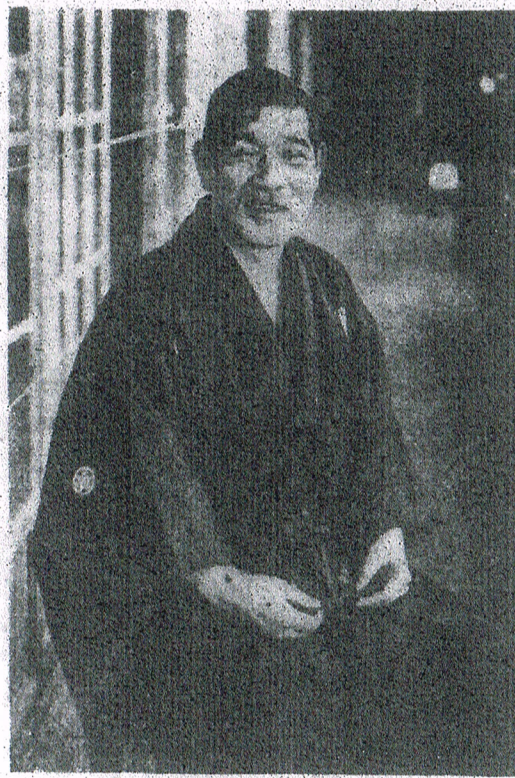
(壽子松未るけ於に室憩休)

それに櫻の花の吹雪を二片三片あしらつたもの、谷川にすいくと一叢の蕨が咲いて、其下にかにが五つ六つ、何れも素人ばなれのした、伊味のある面白い流儀の繪でした。が、私の一番欲しかつたのは銀臺の枕屏風へ、赤く、青く、華やかな慶美人草を描いたもの、惜しい事には最う已に、これもやつぱり賣約済なのでした。 外に一つ賣れてないので『蟻のいとなみ』といふのがありました。これも枕屏風で、楡扇の咲いた庭一面に